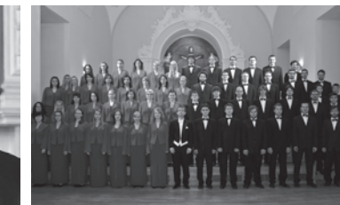
PĚVECKÝ SBOR MASARYKOVY UNIVERZITY

Brněnský varhanní festival oslaví letos půlkulaté výročí. Tricetipět let se řadí v kulturním kalendáři města Brna mezi oblíbené akce, které přináší obhacení červnových večerů. Dlouhá doba existence dokazuje, že varhanní hudba se neustále těší zájmu publika a přitahuje posluchače všech věkových kategorií. Uspořádání pravidelné varhanní recitály napadlo významnou českou varhanníci Alenu Veselou. Svoji myšlenku uskutečnila na jaře roku 1981 a od té doby se rozezněl královský nástroj pravidelně každý rok.