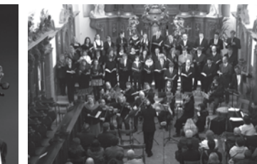
KRÁLOVOPOLSKÝ CHRÁMOVÝ SBOR